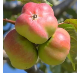
* Api étoilée

Des variétés anciennes, quelques exotiques, des boutures de petits fruits de la Combe de Lancey, un peu de pralin (pas du comestible), un soupçon d'eau, des volontaires et beaucoup de bonne humeur. Voici en somme, la recette qui a permis à une cinquantaine d'arbres de prendre place au Verger du Château.