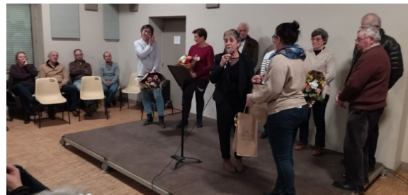
Les 3 couples mis à l'honneur lors de la cérémonie des vœux

Enfin, si le Comité des Fêtes se réjouit d'avoir accueilli récemment de nouvelles bonnes volontés, n'oublions pas qu'il est essentiel d'élargir le cercle afin de garantir des manifestations de qualité et renouveler les propositions au profit de tous. Avis aux amateurs !