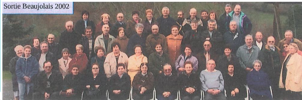
Sortie Beaujolais 2002:

Tous les retraités qui ont envie de se joindre à nous sont les bienvenus.