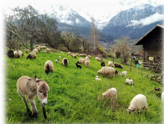
Les futurs pensionnaires de la Croix de Revollat